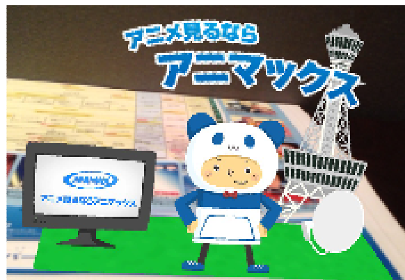
デイリースポーツ (大阪)